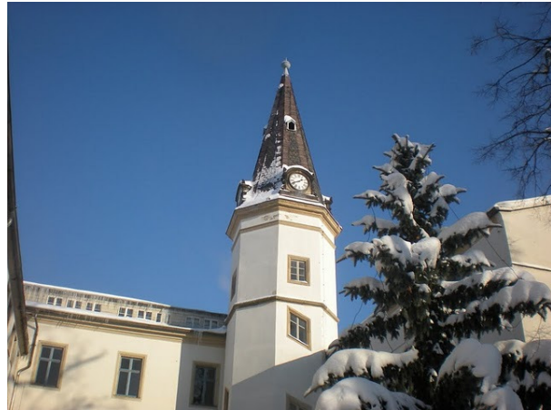
Schloss Nöthnitz war nicht nur wegen des Schnees zum Märchenschloss geworden.